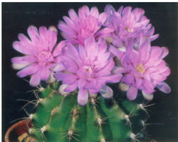
Figure 14 : G. anisitsii subsp. holdii var. tucavocense , une variation inhabituelle à fleurs roses.

G. angelae d'Argentine, de la province de Corrientes, a été décrit dans KuaS par Massimo Meregalli en 1998. Il a depuis été reclassé sous G. denudatum , G. angelae n'est donc plus.